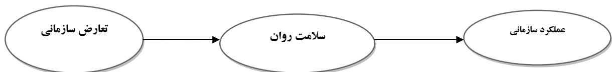
شکل (۱): مدل مفهومی پژوهش