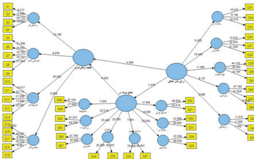
نمودار ۲: مدل پژوهش در حالت معنی‌داری ضرایب

(نمودار ۲) مدل تحقیق در حالت معنی‌داری ضرایب (T-value) را نشان می‌دهد.