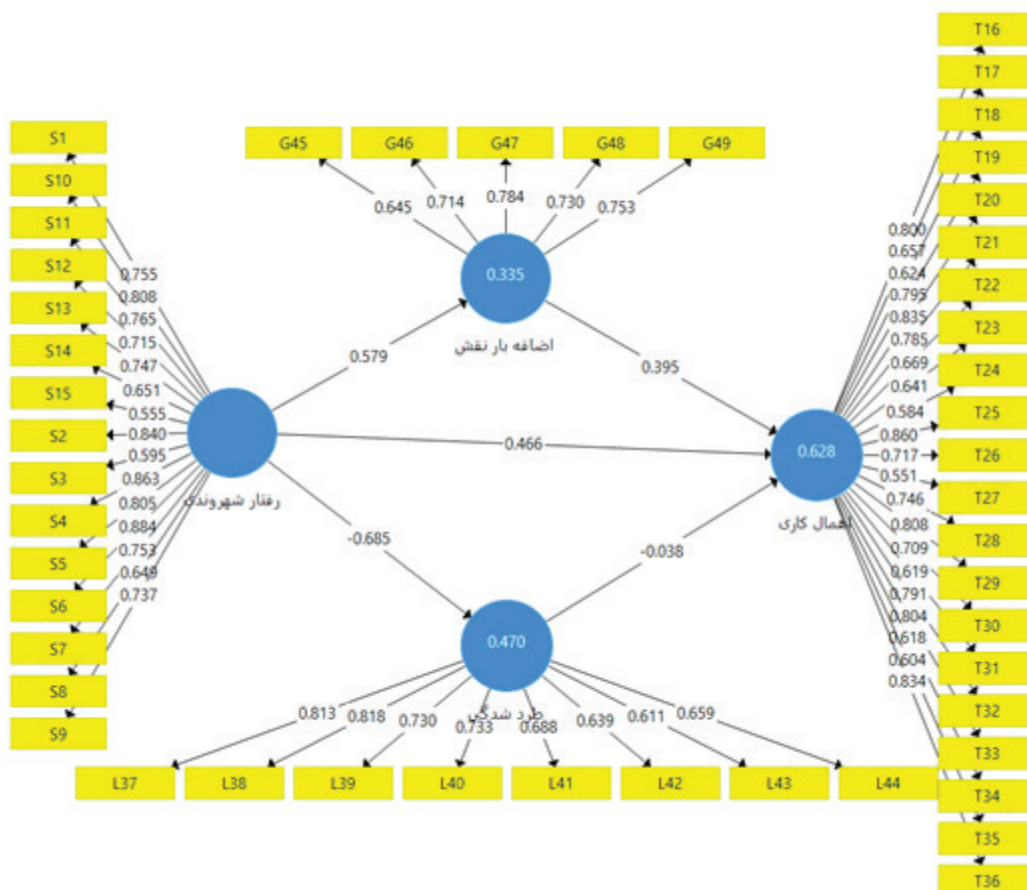
شکل ۲. ضرایب مسیر و بارهای عاملی مدل پژوهش